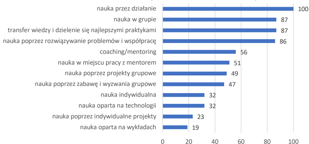
NAJBARDZIEJ PRZYDATNE FORMY NAUKI W OPINII UCZESTNIKÓW BADANIA ANKIETOWEGO (WIELOKROTNE WSKAZANIA)